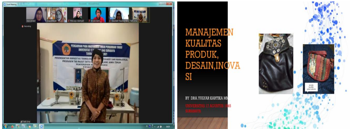
Gambar 4. Acara Serah Terima Mesin Jahit kepada Mitra via Zoom

lainnya (Wirawan, 2019). Sedangkan yang dimaksud dengan overhead pabrik terkait dengan sarana atau alat produksi yang mendukung berjalannya produksi untuk menghasilkan produk yang diinginkan atau yang dipesan oleh konsumen.