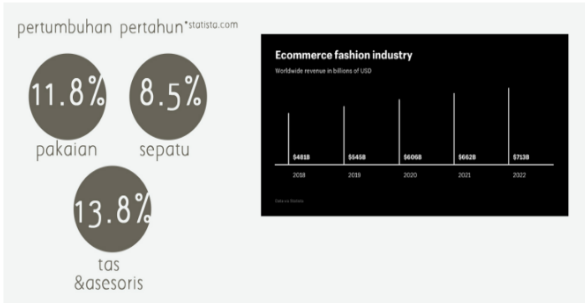
Gambar 1. Chart Pertumbuhan Industri Fashion Dunia

8% dibandingkan dengan pertumbuhan industri pakaian dan sepatu yang mencapai masing-masing 11.8% dan 8.5%.