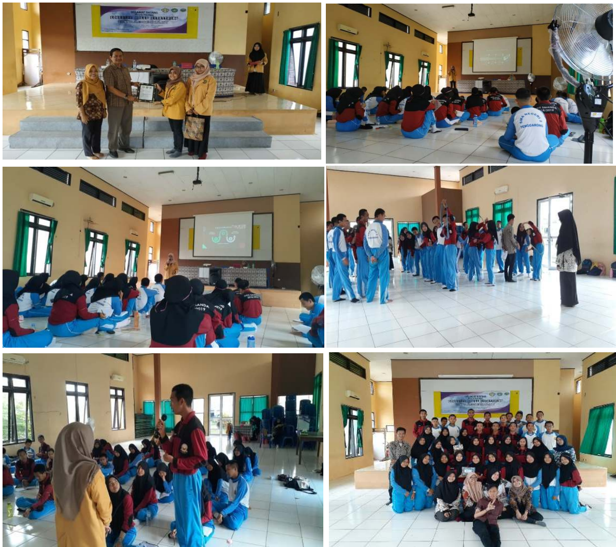
Gambar 3. Kegiatan Pelatihan