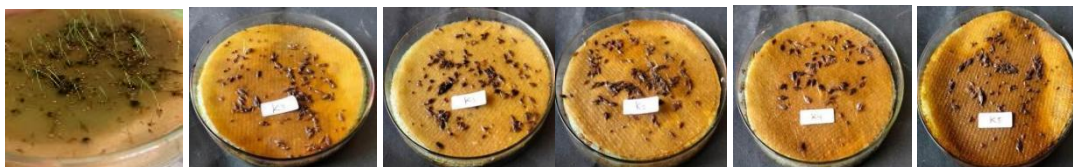
Gambar 2. Perkecambahan benih Eleusine indica akibat aplikasi ekstrak Clidemia hirta pada 14 HSA