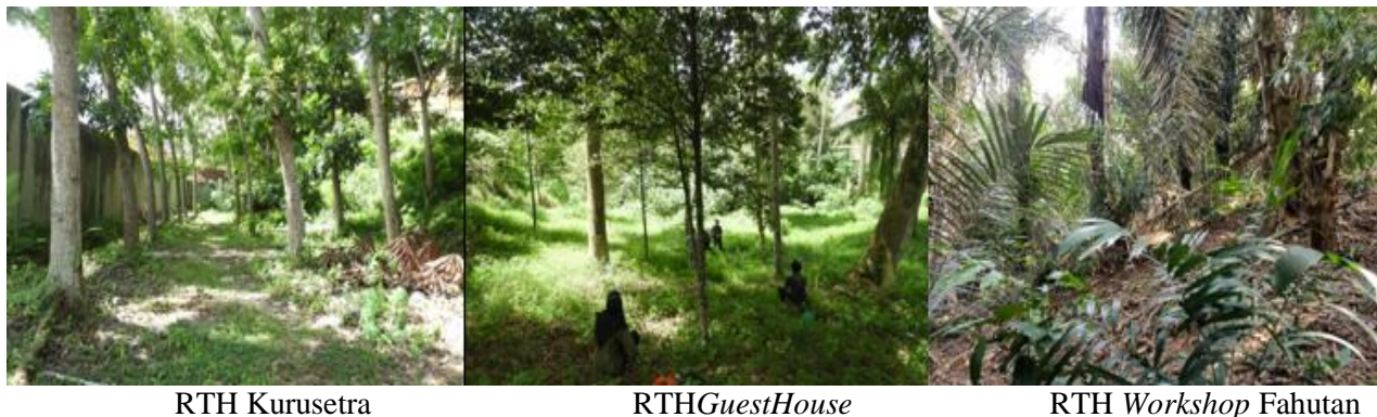
Gambar 2. Lokasi ketiga plot penelitian

Keterangan: Lokasi 1= RTH Kurusetra; Lokasi 2 =RTH Guest House ; dan Lokasi 3 = RTH Workshop Fahutan