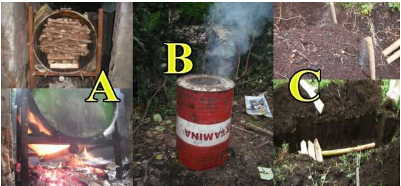
Gambar 1. Metoda pembuatan biochar ; A = teknik drum tertutup ( retort ), B = teknik drum terbuka, dan C = teknik tradisional.