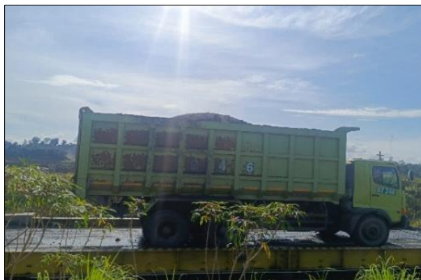
Gambar 2. Bucket Fill Factor vessel DT Hino

Fill Factor dump truck Liugong DW90A dan Hino 500 sebesar 100%, hal ini dikarenakan material yang di loading merupakan batubara yang sudah berada di area Product Coal Stockpile sehingga tidak mengalami kesulitan saat melakukan loading .