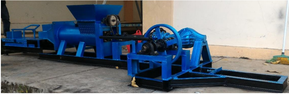
Gambar 2. Mesin Mencetak Batu Bata

Gambar 2 di atas menunjukkan mesin pencetak batu bata yang digunakan dalam mencetak batu bata. Mesin tersebut terdiri dari 3 bagian yaitu (1) pembuat adonan, (2) pencetak batu bata, dan (3) pemotong batu bata. Mesin pencetak batu bata tersebut menggunakan mesin diesel dengan tenaga 24 HP sebagai mesin penggerak. Pada saat mesin pencetak batu bata tersebut diuji, memberikan hasil sebagaimana pada Tabel 1.