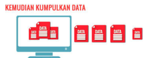
Gambar 5. Cuplikan penggalan 4

Penggalan 4 berisi informasi tentang alur melakukan penelitian, berisikan poin poin penting yang biasa terdapat di kegiatan penelitian setelah seminar proposal.