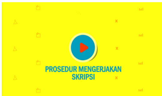
Gambar 2. Cuplikan Penggalan 1

Penggalan 1 berupa opening scene, menampilkan judul dari animasi dan nama institusi kampus FKTI Universitas Mulawarman, yang menandakan bahwa animasi ini dibuat berdasar prosedur yang ada di lingkungan FKTI Universitas Mulawarman.