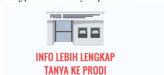
Gambar 7. Cuplikan penggalan 6

Penggalan 6 merupakan penggalan terakhir, menampilkan saran untuk mencari tau informasi lebih ke program studi bila masih ada yang ingin diketahui, dan menampilkan credit scene informasi tentang pembuat animasi yaitu penulis sendiri.