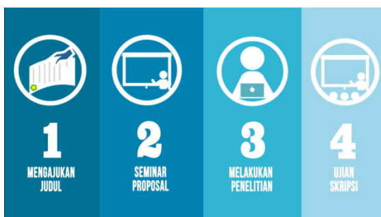
Gambar 3. Cuplikan Penggalan 2

Penggalan 2 menjelaskan tentang prosedur mengerjakan tugas akhir skripsi secara garis besar dan menampilkan syarat syarat mengerjakan tugas akhir skripsi. Dari syarat akademik hingga syarat administrative.