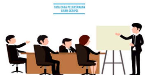
Gambar 6. Cuplikan penggalan 5

Setelah melakukan penelitian maka langkah selanjutnya adalah mempersiapkan ujian skripsi. Pada penggalan ini ditampilkan informasi tentang syarat syarat melakukan penelitian dan tata cara melakukan penelitian.