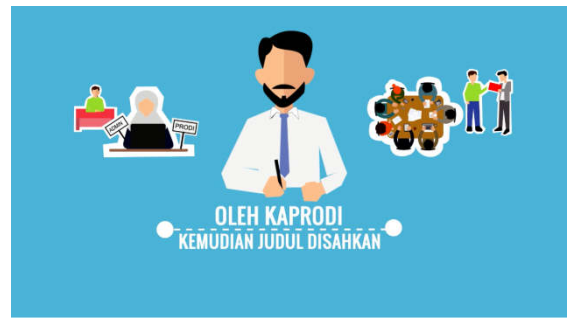
Gambar 4. Cuplikan penggalan 4

Penggalan 3 menampilkan informasi prosedur mengajukan judul hingga seminar proposal secara detail. Dengan disertakan ilustrasi aktivitas, untuk semakin mudah dan cepat di pahami.