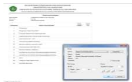
Gambar 15. Form Monitoring

Pengujian form monitoring pada absensi dilakukan dengan cara mengklik tombol monitoring maka akan tampil halaman laporan hasil monitoring perkuliahan yang bias kita lihat pada gambar 15 berikut ini :