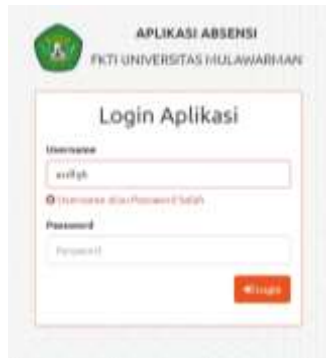
Gambar 11. Login Menggunakan Data Yang Salah

benar. Seperti yang terlihat pada gambar 11 berikut ini :