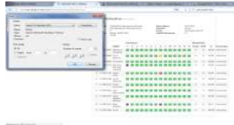
Gambar 14. Cetak Rekapitulasi

Pengujian form cetak pada rekap absensi dilakukan dengan cara mengklik tombol cetak pada yang ada dipojok kanan atas halaman rekap. Setelah diklik maka akan ada tampilan halaman cetak seperti yang kita lihat pada gambar 14 berikut ini :