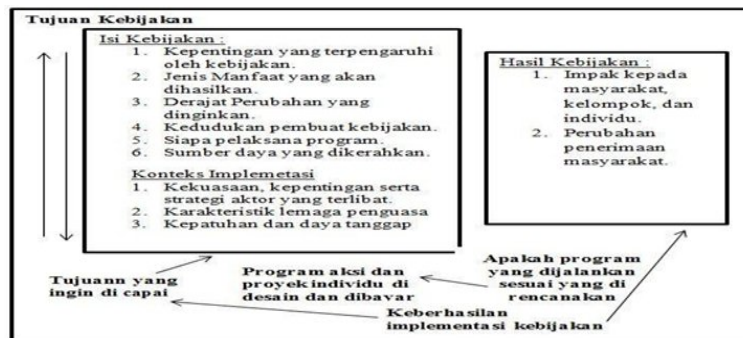
Gambar 3. Model M.S. Grindle

Dengan demikian, keberhasilan implementasi kebijakan dipengaruhi oleh faktor-faktor ini, termasuk isi kebijakan dan konteks implementasinya.