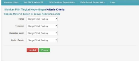
Gambar 6 Tampilan Pemilihan Kriteria