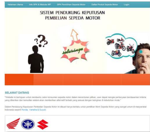
Gambar 3 Tampilan Halaman Utama

Pada aplikasi ini terdapat empat halaman untuk user dan satu halaman untuk admin. User dapat mengakses Halaman Utama, Halaman Info SPK dan Metode WP, Halaman SPK Pemilihan Sepeda Motor, dan Halaman Produk Sepeda Motor, sedangkan Halaman Login diperuntukan untuk admin. Ketika pertama kali mengakses sistem, yang akan muncul di awal adalah halaman utama sebagai menu pertama. Halaman utama bisa dilihat pada gambar 3.