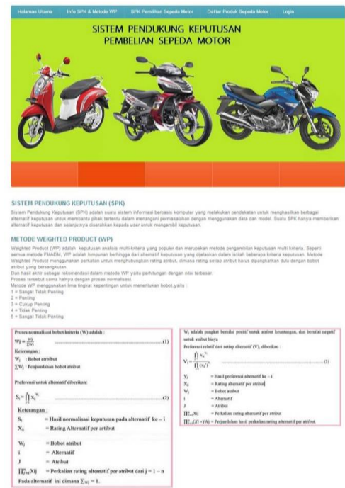
Gambar 4 Tampilan Halaman Info SPK dan Metode WP

Halaman pada menu SPK Pemilihan Sepeda Motor terdiri dari :