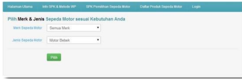
Gambar 5 Tampilan Pemilihan Merk dan Jenis