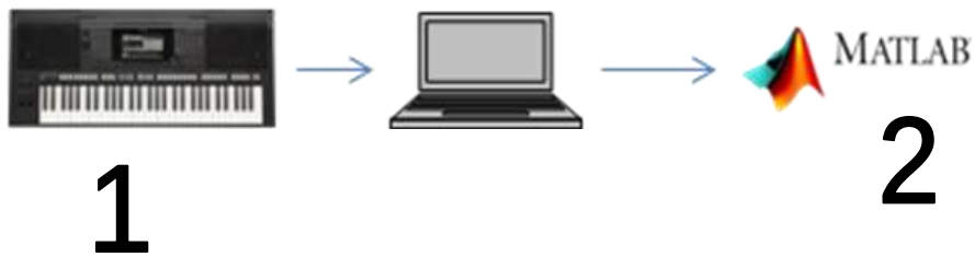
Gambar 1. Desain alur penelitian