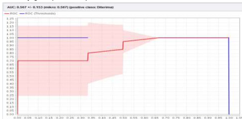
Gambar 1. Kurva ROC/AUC dengan 55 % Data Training

Dari tabel 1 dari 68 data training hasil akurasi confusion matrix Algoritma ID3 menggunakan RapidMiner dengan 55% data training sebesar 94,29 %. Tingkat akurasi Algoritma ID3 juga dapat dilihat pada Gambar 1. kurva ROC/AUC.