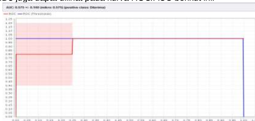
Gambar 3. Kurva ROC/AUC dengan 75 % Data Training

Dari tabel 3 dari 92 data training hasil akurasi confusion matrix Algoritma ID3 menggunakan RapidMiner dengan 75% data training sebesar 97,89 %. Tingkat akurasi Algoritma ID3 juga dapat dilihat pada kurva ROC/AUC berikut ini: