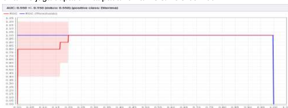
Gambar 4. Kurva ROC/AUC dengan 85 % Data Training

Dari tabel 4 dari 105 data training hasil akurasi confusion matrix Algoritma ID3 menggunakan RapidMiner dengan 85% data training sebesar 97,27 %. Tingkat akurasi Algoritma ID3 juga dapat dilihat pada kurva ROC/AUC berikut ini: